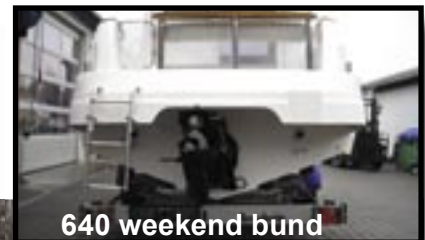
640 weekend bund