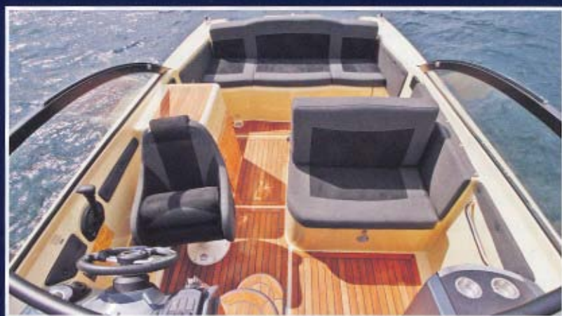
Mørk, lækker og enkel indretning. Inspiration hentet fra Askeladden 645 Beetle.