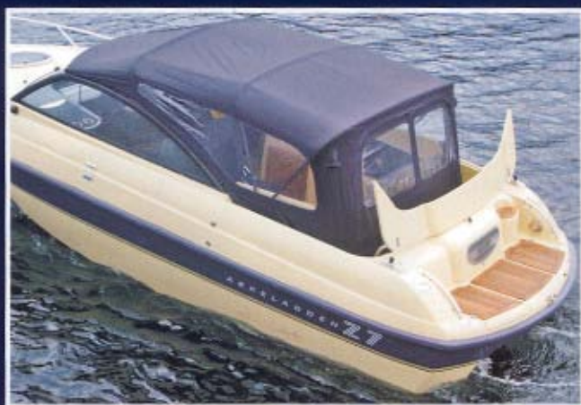
Z-toppen er cabriolet-typen og sættes på under 15 sekunder.