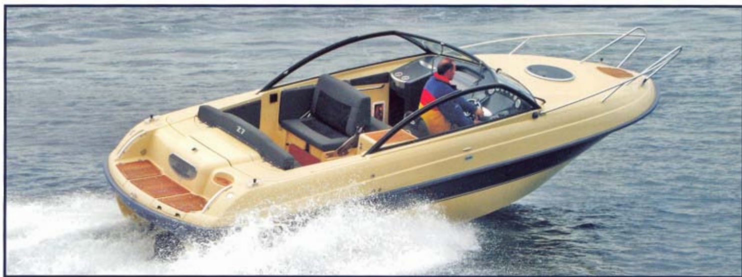
Askeladden er en lækker daycruiser som fanger opmærksomhed på vandet.

Daycruiseren Z7 er Askeladdens førstefødte i værftets nye storsatsning: Z-serien. Om bord findes løsninger som vækker opmærksomhed i bådverdenen.