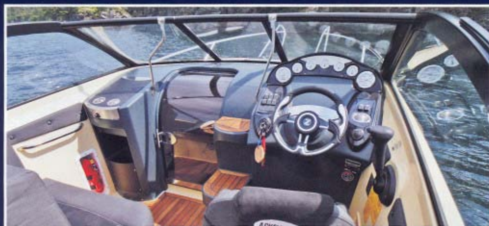
Lækkert og sporty instrumentpanel, men enkelte plastdetaljer trækker ned.