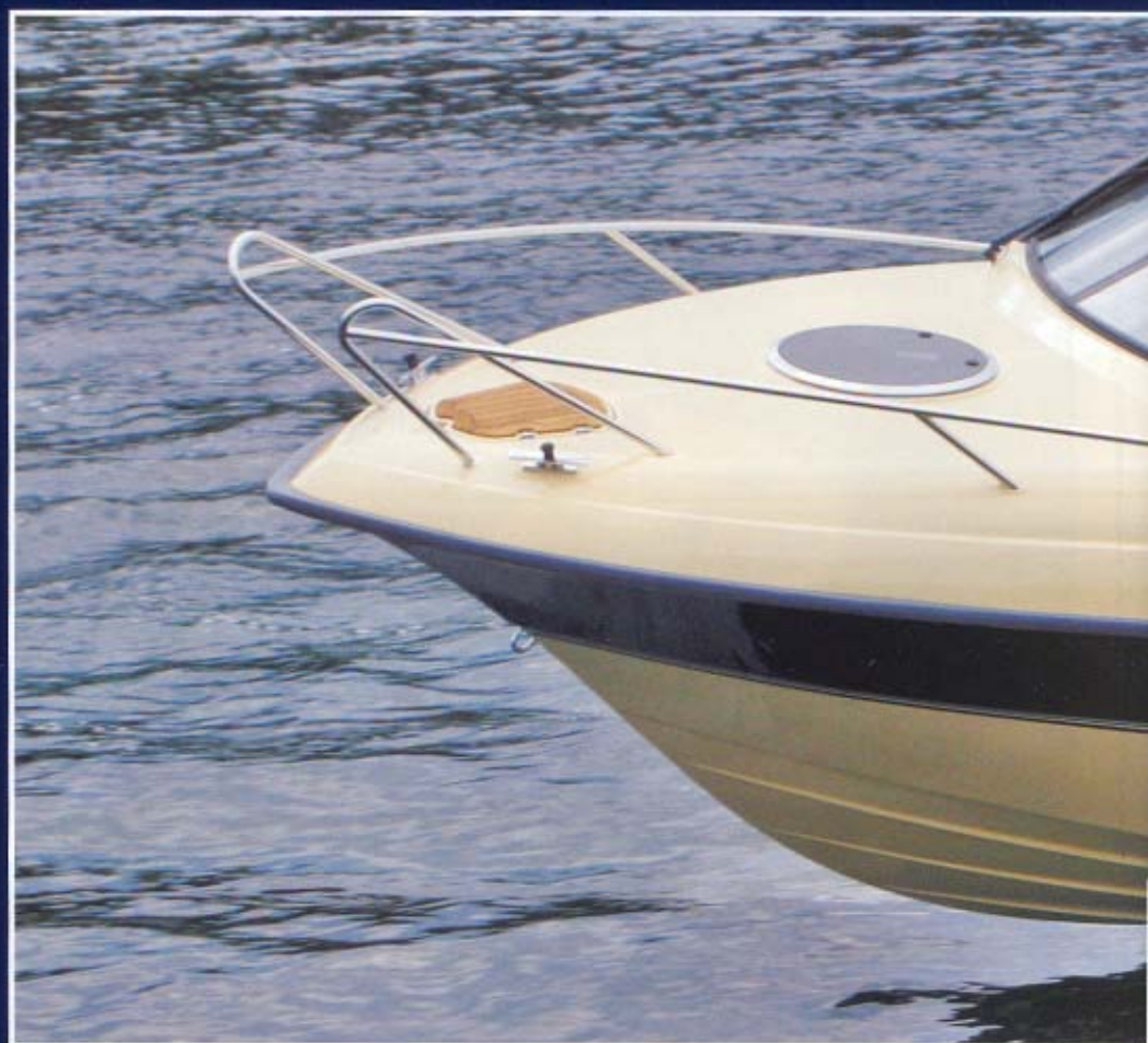
Båden har et nyudviklet skrog som er værftets bedste gennem tiderne.