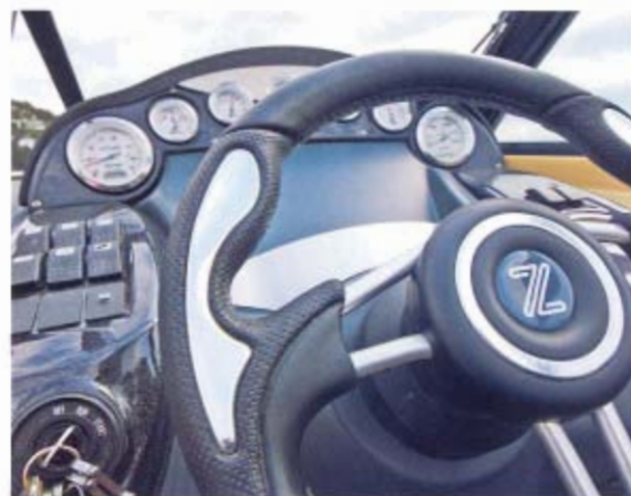
Z7 har et sporty og pænt instrumentpanel.

at rode for meget med fortøjningen. Q-sengen fremkommer når rygstøtten i co-pilotbænken lægges bagover, og hurtigt har man en solmadras til en voksen. Dermed slipper man for pladskrævende ekstra plader med hynder. →